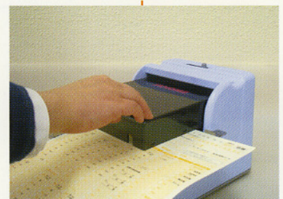
■ 二重印字防止機構付